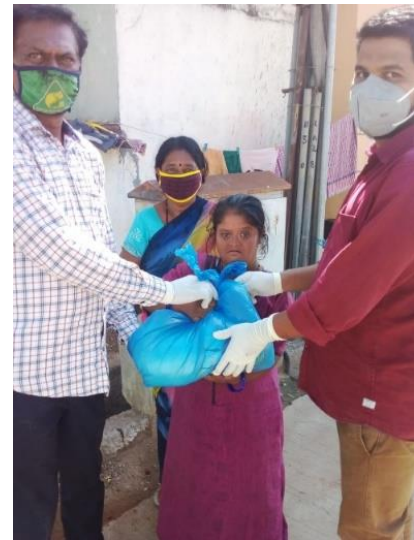
Corona-Nothilfe - Verteilung der Lebensmittelspenden in Indien Mehr Fotos von der Hilfe vor Ort in Indien finden Sie auf der Homepage unserer Pfarrei.